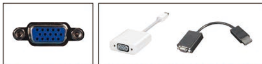
ミニD-sub15ピン 他コネクターからの接続変換ケーブル例

持ち込みが可能な機種は、モニター出力端子にHDMIもしくはミニD-sub15ピンが装備されているものになります。薄型PCでは出力端子の規格が異なることがあります。その場合には必ず接続変換アダプタをご持参ください。DisplayPortやDVIでは出力できません。また、事務局が準備したプロジェクターと接続できない場合に備え、PowerPointで作成した発表用データを入れたUSBメモリをバックアップとして必ずご持参ください。